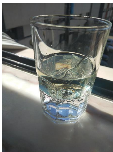
Rafael Rocha, 8º1