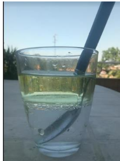
Renato Pina, 8º 3