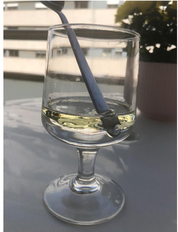
Luiza Chagas, 8.º3