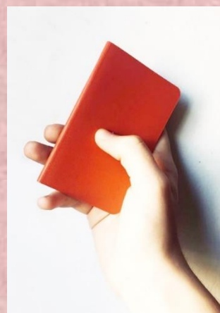
figura 1 - o moleskine de bolso

Quanto a mim, quando precisar de novo caderno, comprarei exclusivamente um moleskine de bolso? Provavelmente não. Mas, entretanto, aprendi que consigo dele resultados inesperados quando o utilizo com outra orientação. E poderei levá-lo, mesmo, para todo o lado!