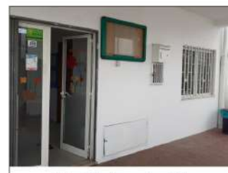
J.I. Trás da Serra